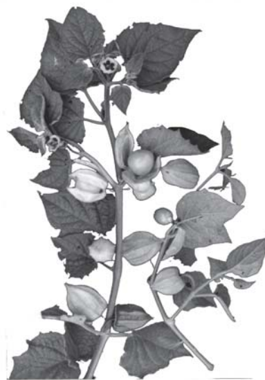
Фиг. 1. Разклонение от физалис, сорт „Пловдив” Fig. 1. Branche with leafs from cape gooseberry, variety Plovdiv

Листата са със сърцевидна форма (фиг. 1), средно назъбени и овласени, а повърхността им е средно нагъната. Оцветени са в зелено до тъмнозелено. Средната дължина на листа достига до 9,5 cm, а широчината - до 7,8 cm.